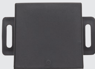
Centralina Main unit